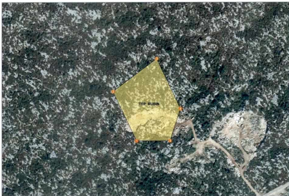
Grafički prikaz eksploatacijskog polja arhitektonsko-građevnog kamena "Rubin":